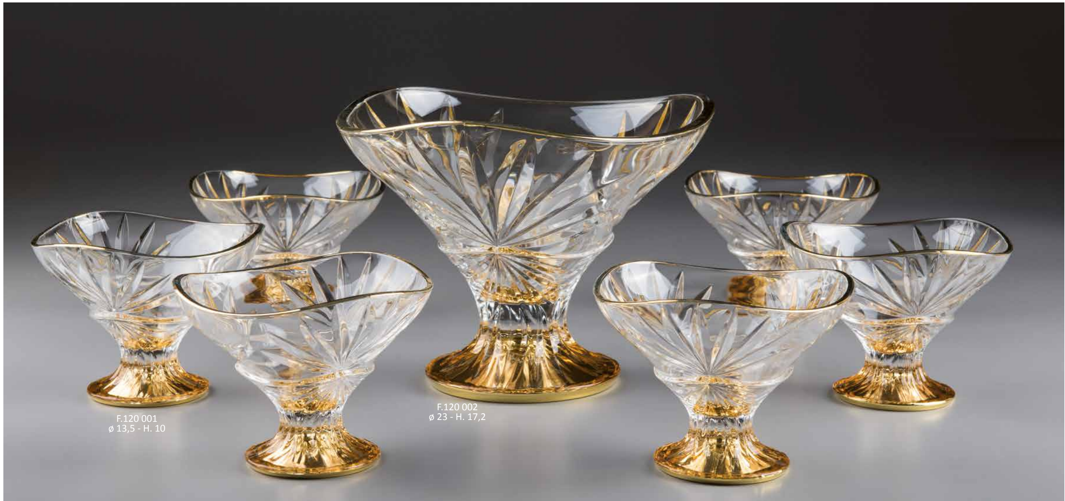
F.120 001 ø 13,5 - H. 10