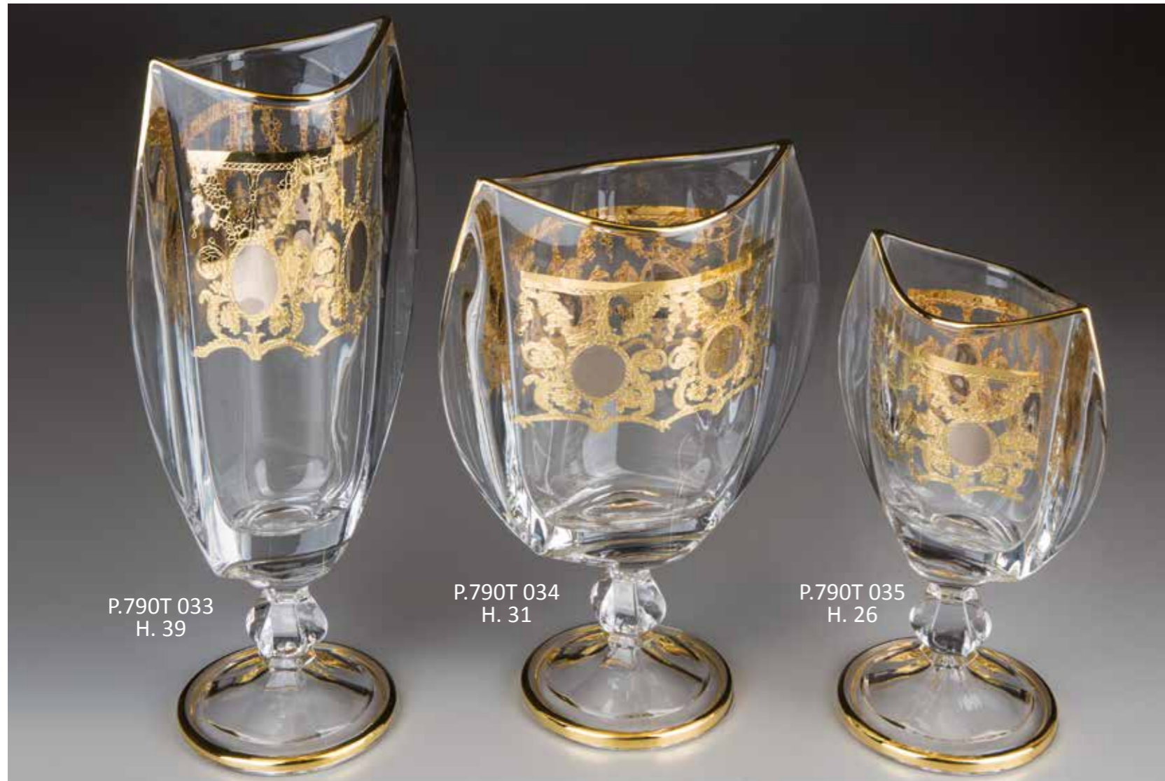
P.790T 033 H. 39