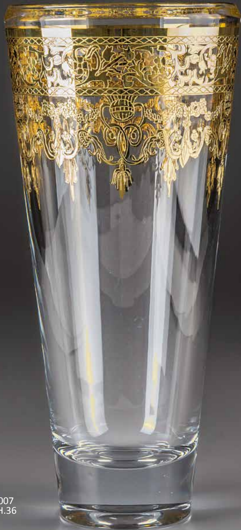
P.10T 007 ø 16 - H.36