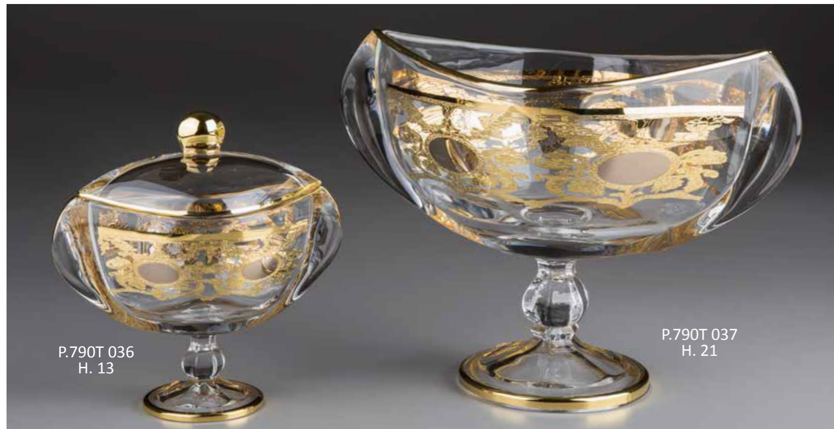
P.790T 036 H. 13