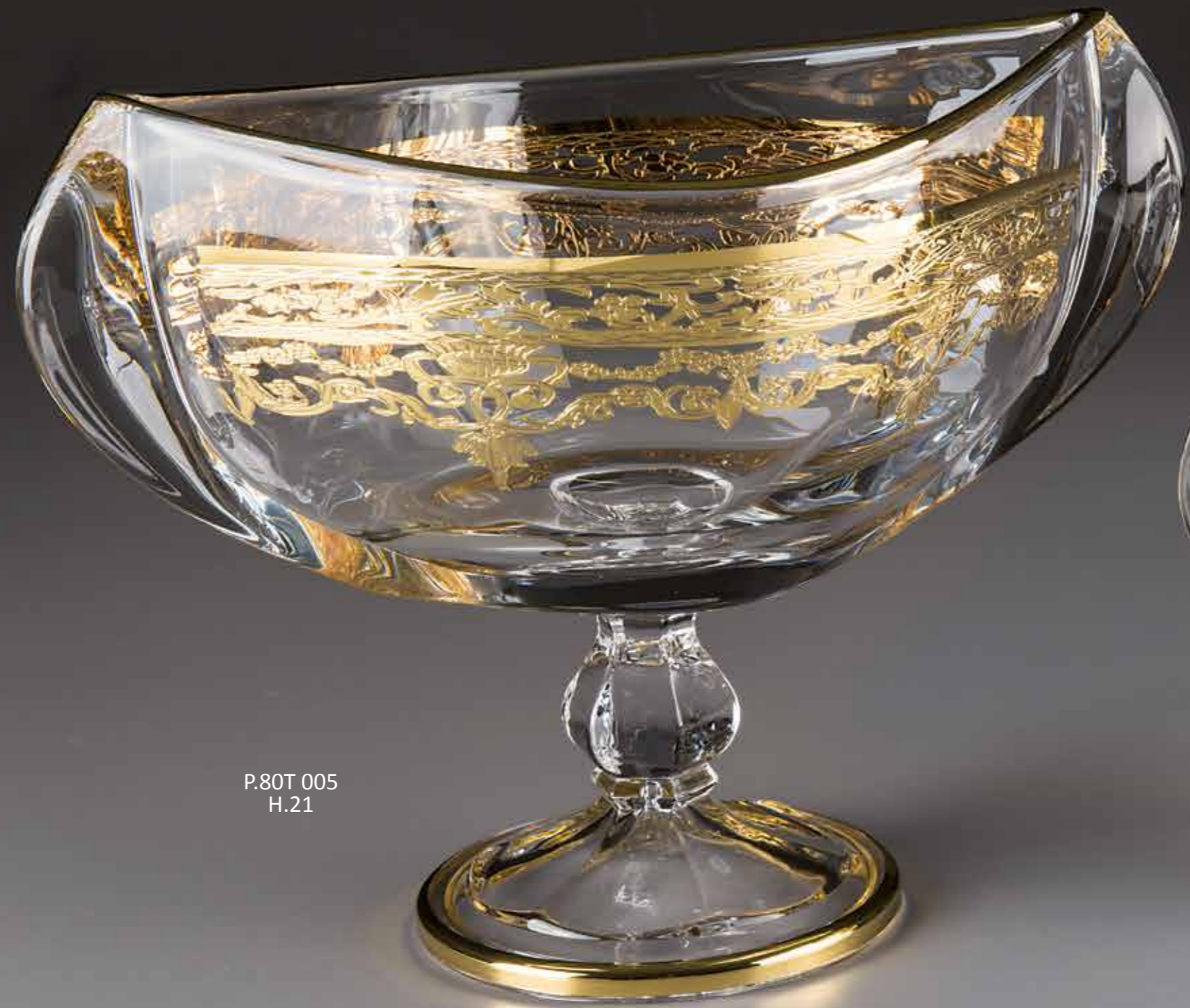
P.80T 005 H.21