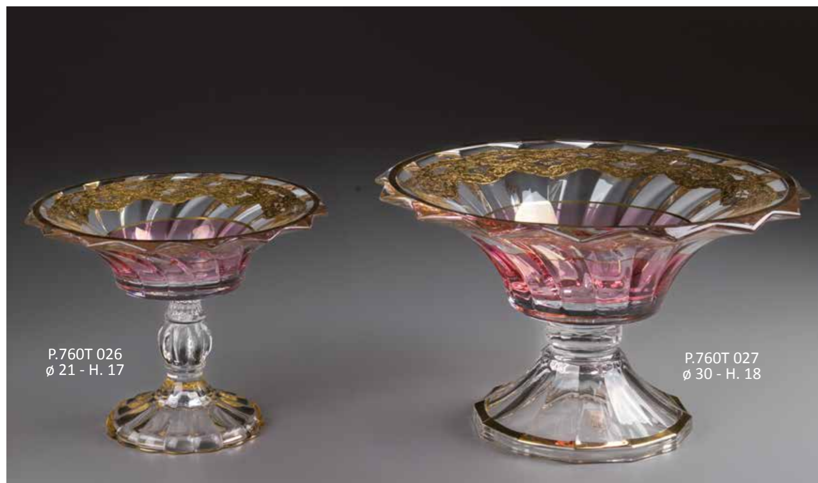
P.760T 026 ø 21 - H. 17