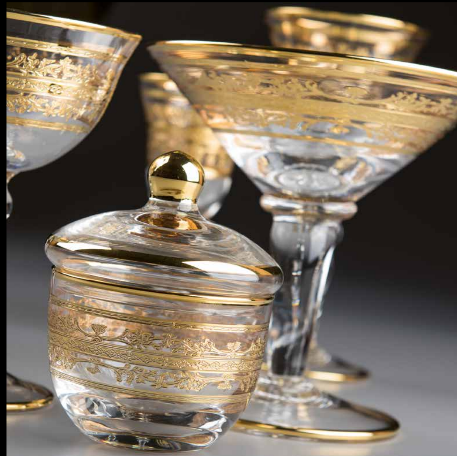
P.760T 027 ø 30 - H. 18