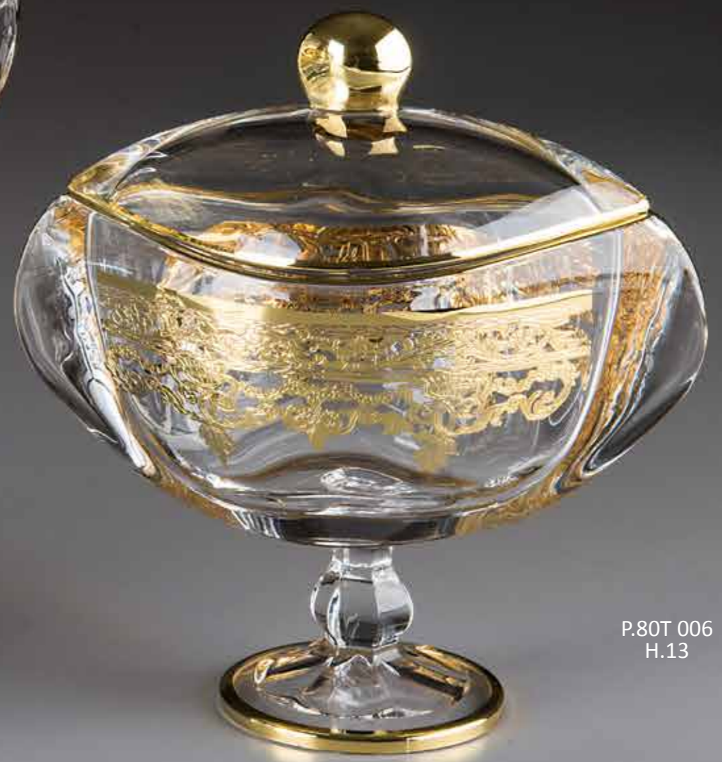
P.80T 006 H.13