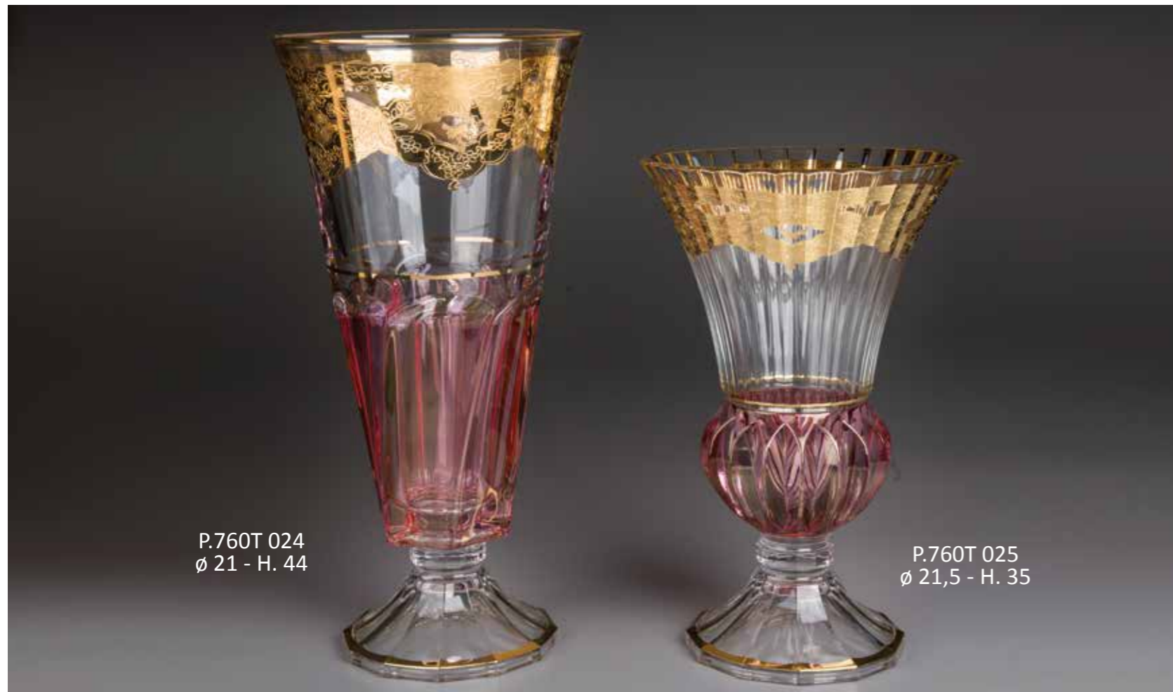
P.760T 024 ø 21 - H. 44