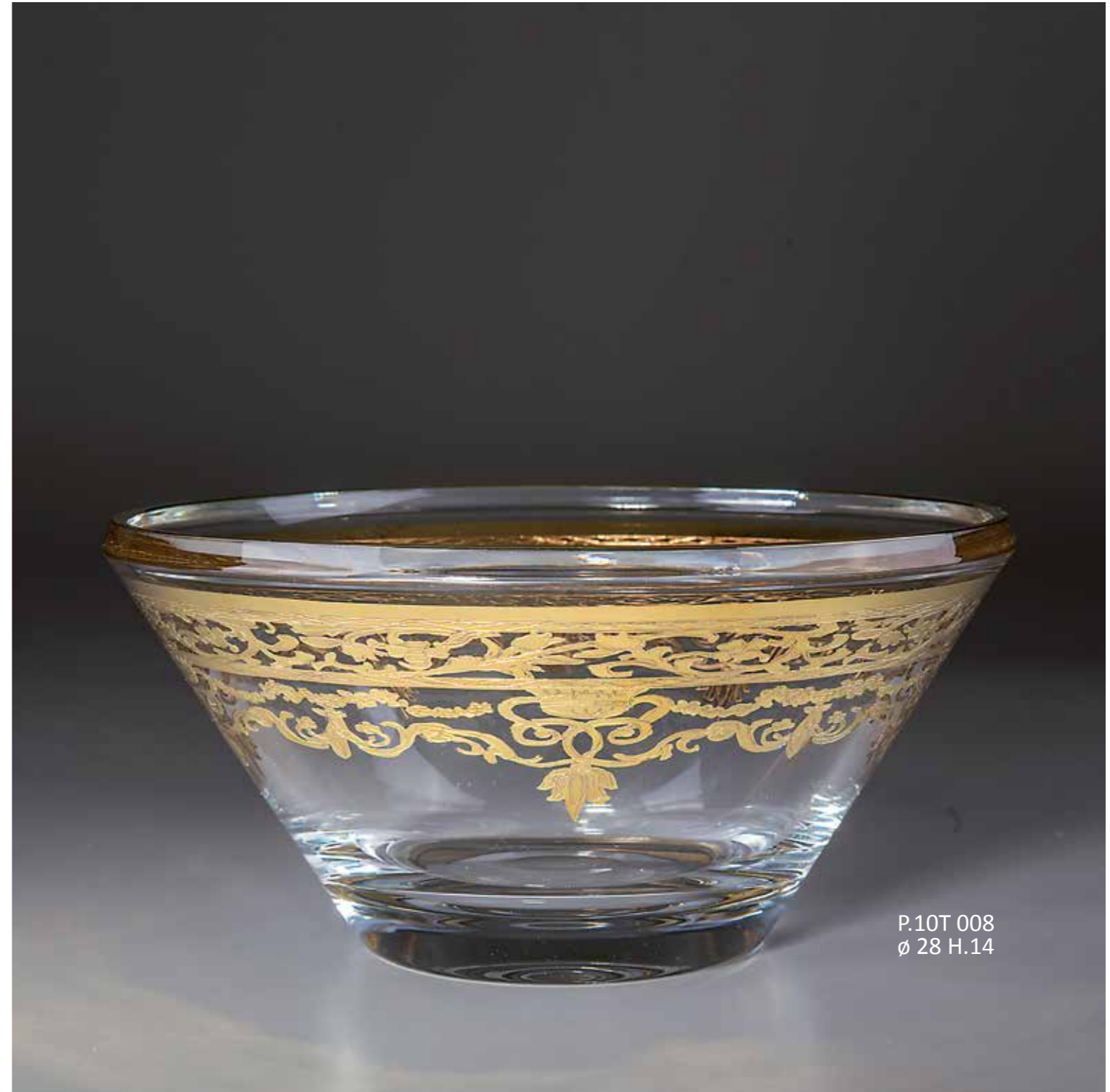
P.10T 008 ø 28 H.14