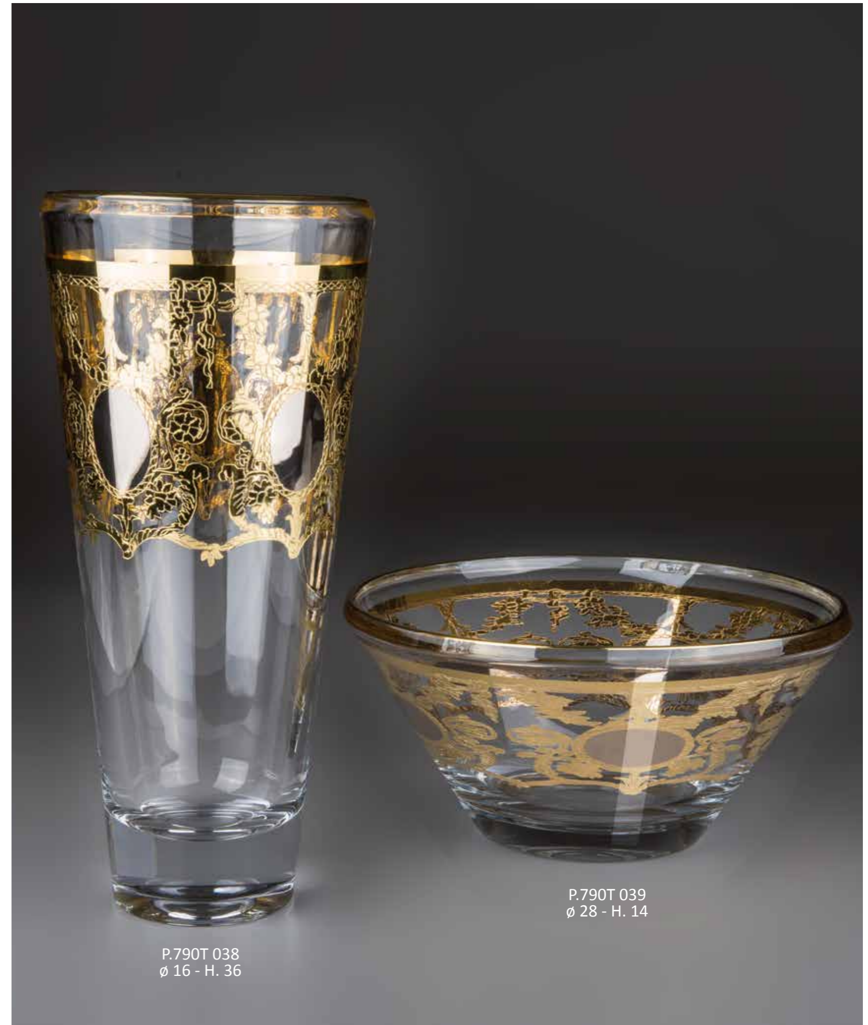
P.790T 038 ø 16 - H. 36